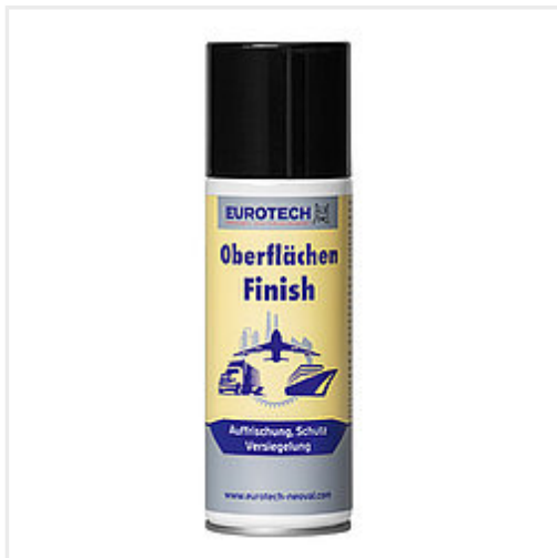
Art. Nr. 836 200 Aerosoldose 200 ml